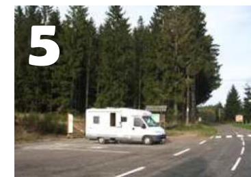
Table de lecture du paysage ; proche circuit de randonnée Le Roséria (départ Mairie de la Rosière) et Domaine nordique.

Stationnement gratuit pour 2 camping-cars,